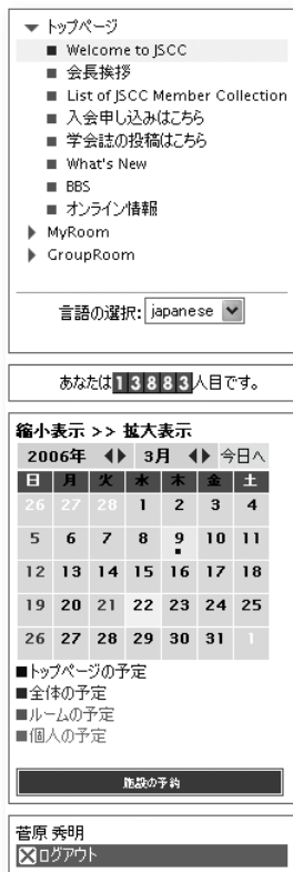
図2 ログイン後の画面左側