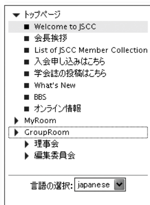
図3 Group Room の表示